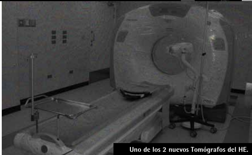
Uno de los 2 nuevos Tomógrafos del HE.

Inician servicios de tomografía con el objetivo de brindar una mejor atención a los pacientes que requieren de esta tecnología de punta. Los dos tomógrafos están valorados en 12 millones de dólares y fueron adquiridos mediante un préstamo con el Banco Centroamericano de Integración Económica (BCIE).